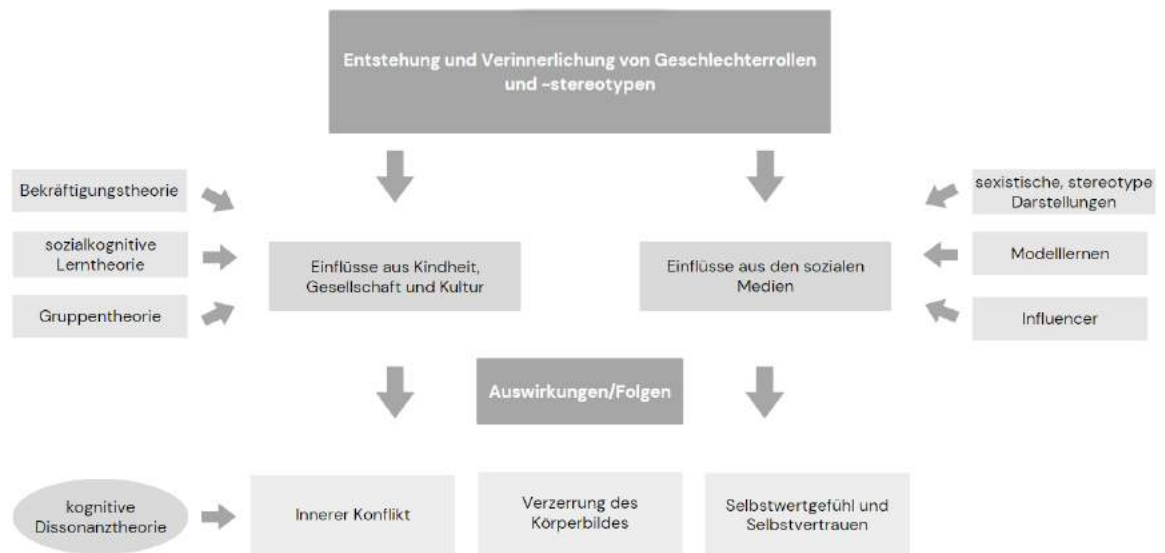
Abb. 3: Zusammenfassende Darstellung der Erkenntnisse (Eigene Darstellung).